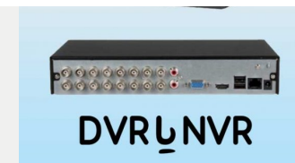
ضبط کننده ویدئویی

تصور کنید که خرید دوربین مدار بسته را انجام داده اید ، شما یک دوربین مدار بسته داریم که با استفاده از سنسور های تصویری تصاویر را از طریق لنز ضبط می کنند ، تصاویر و صدا ها به صورت بی سیم یا با کابل به ضبط کننده ویدئویی منتقل می شوند. ضبط کننده های ویدئویی از نرم افزارهای تحلیل تصویر و سایر فناوری های هوشمند برای بررسی کردن داده ها و ارسال هشدارهای خودکار به شما بهره می برد. این نرم افزار مدیریت ویدئویی یا (VMS) خروجی های ویدئویی را ضبط ، ذخیره و تجزیه و تحلیل می کند ، این نرم افزار از الگوریتم های یادگیری ماشینی (ML) استفاده می کند که از فناوری هایی مانند تشخیص حرکت ، تشخیص چهره ، شمارش افراد و غیره که این موارد در قیمت دوربین مدار بسته نقش بسزایی دارند.