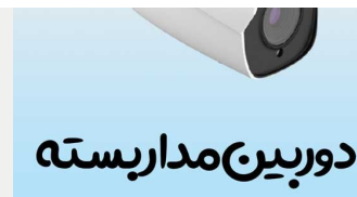
دوربین مدار بسته